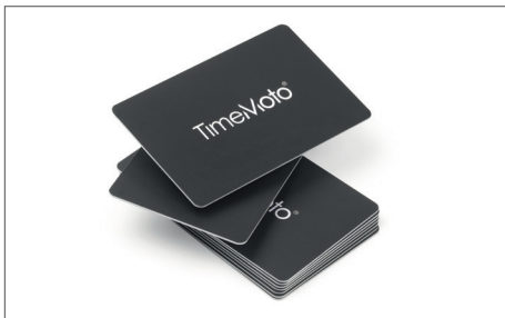
TimeMoto RF-100 一套25张卡 Art. no: 125-0603