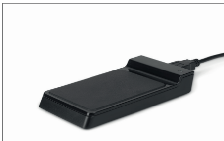
TimeMoto RF-150 USB RFID 读卡器 Art. no: 125-0605