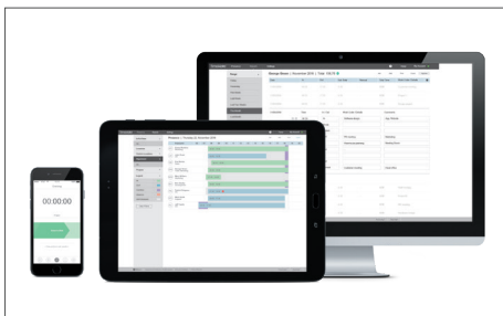
TimeMoto 云端 / TimeMoto电脑+软件 Art.no: 139-0612 / 139-0613