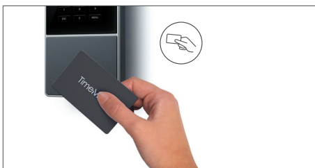
以RFID感应卡, 感应匙扣, 及密码考勤

* 于30天试用后, 请选择您的订购: TimeMoto 云端 要么 TimeMoto 云端+