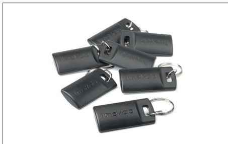
TimeMoto RF-110 一套25个匙扣 Art.no: 125-0604