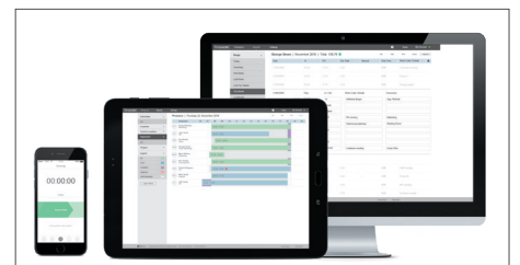
附送TimeMoto云端+ 30天试用版