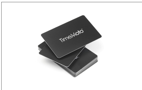
TimeMoto RF-100 - conjunto de 25 cartões RFID Art. nº: 125-0603