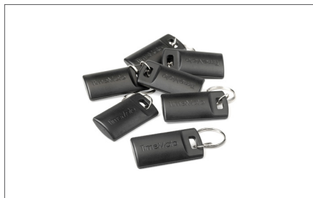
TimeMoto RF-110 - conjunto de 25 chaves RFID Art. nº: 125-0604