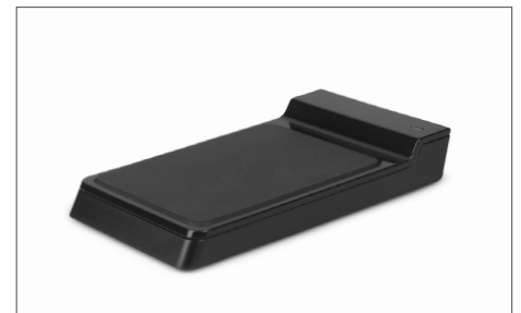
TimeMoto RF-150 - Leitor RFID por USB Art. nº: 125-0605