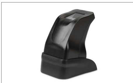
TimeMoto FP-150 - Leitor de impressões digitais por USB Art. nº: 125-0606