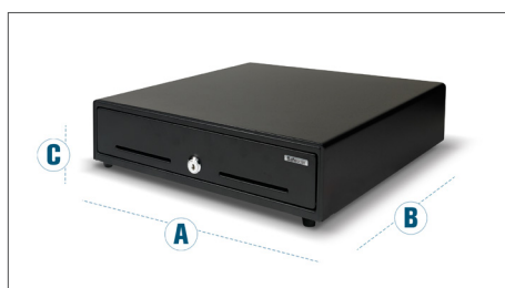
Dimensões: A: 35 cm - B: 40.5 cm - C: 10.5 cm