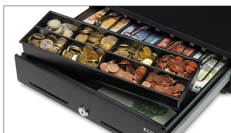
Tabuleiro amovível para 8 moedas diferentes