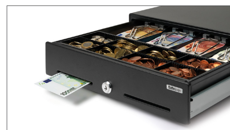
Ranhura separadora para denominações mais elevadas e papeis valiosos