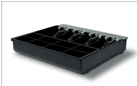
Safescan 3540T Tabuleiro de caixa para dinheiro Art. no: 132-0428