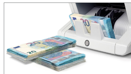
Função Lote, para criar séries fixas de um número predeterminado de notas