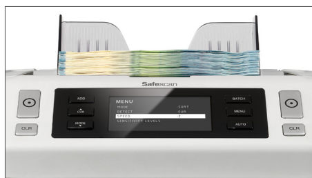
Velocidade de contagem ajustável - 800, 1.200 ou 1.500 notas por minuto