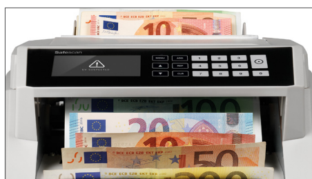
Alerta visual e acústico quando é detetada uma nota falsa suspeita