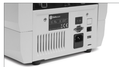
Botão On/Off, ligação à corrente e roda de ajuste