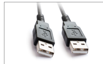
Safescan USB Cable Art. no: 124-0458