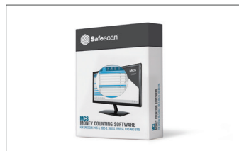
Safescan MCS Software Art. no: 124-0500