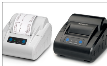
Safescan TP-230 Impressora térmica Art. no: 134-0475 cinzento Art. no: 134-0535 preto