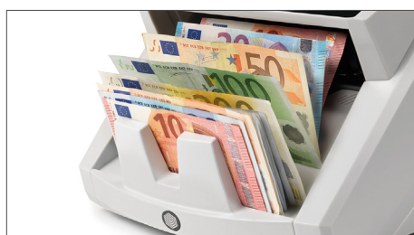
Conta notas organizadas de todas as divisas