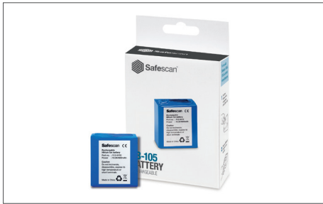
Safescan LB-105 Bateria recarregável Art. no: 112-0410