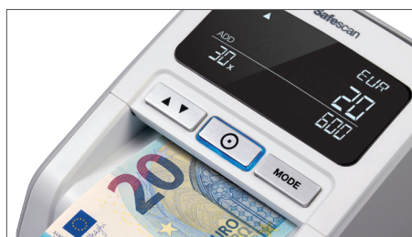
Mostra quantidades e totais