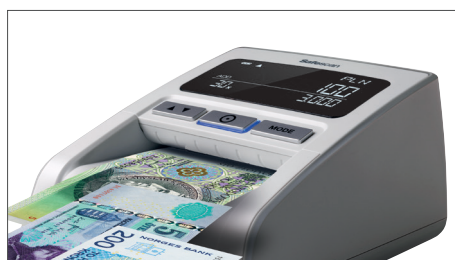
Verifica 9 moedas internacionais