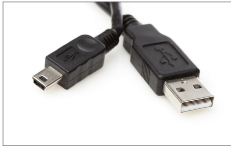
Safescan Cabo USB atualização Art. no: 112-0459