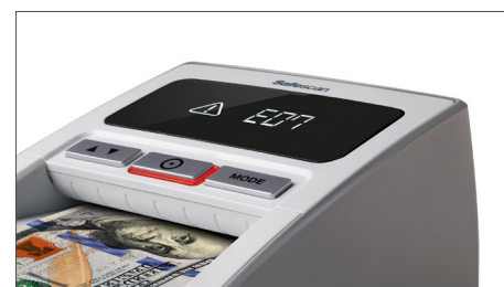
Alarme de nota suspeita, com alerta visual e acústico