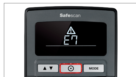
Alarme de nota suspeita, com alerta visual e acústico