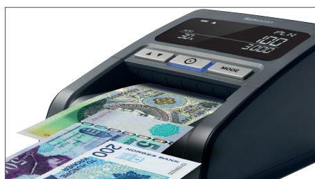
Verifica 9 moedas internacionais