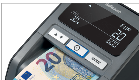
Mostra quantidades e totais