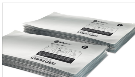
2 verschillende cleaning cards voor een optimaal resultaat