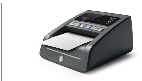
Cleaning cards voor het reinigen van valsgelddetectoren