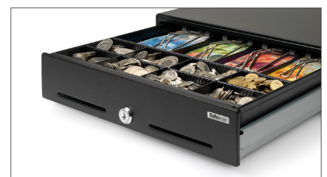
Fessura di separazione per il deposito di banconote di grande taglio e valori