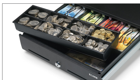
Vassoio rimovibile per 8 diverse monete