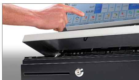
Facilità di combinazione con i registratori di cassa e gli ambienti POS esistenti