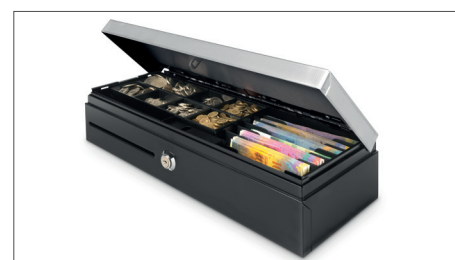
Per 8 banconote e 8 monete