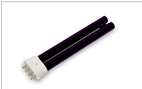
Safescan UV 50 / 70 Lampade UV Art. no: 131-0411