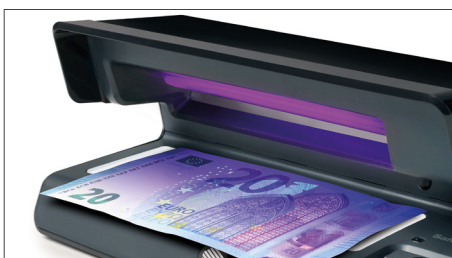
Verifica le caratteristiche UV delle banconote