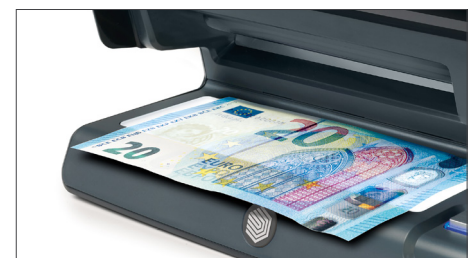
Grande area LED a luce bianca per verificare filigrana, filo metallico e microstampe