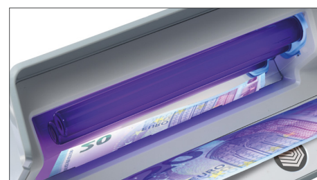
Riflettore unico per una qualità della luce UV migliorata