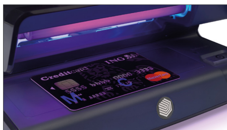
Verifica le caratteristiche UV delle carte di credito