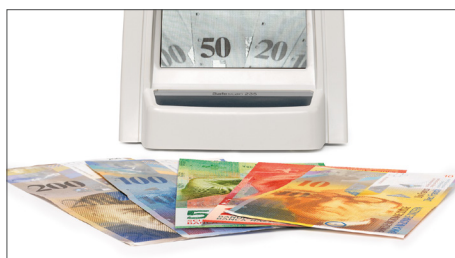
Verifica le proprietà a infrarossi delle banconote in euro