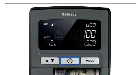
Affiche la quantità et les totaux