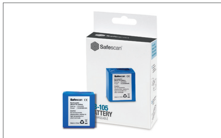
Safescan LB-105 Batteria ricaricabile Art. no: 112-0410