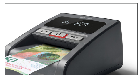
Allarme per banconote sospette con avviso visivo e audio