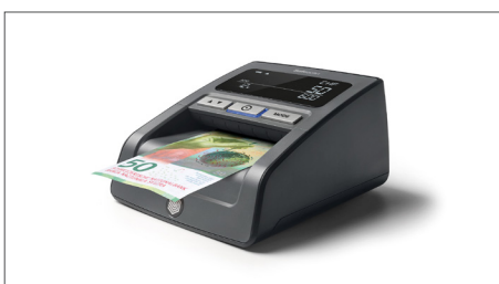
Inserimento di banconote in euro in qualsiasi direzione