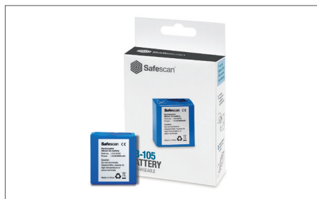
Safescan LB-105 Batteria ricaricabile Art. no: 112-0410