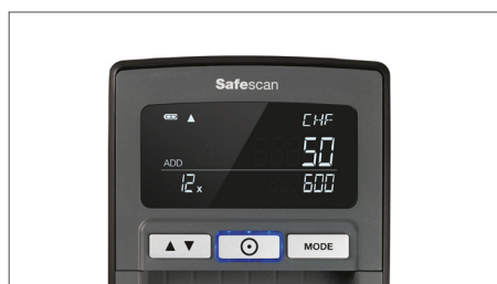
Mostra quantità e totali