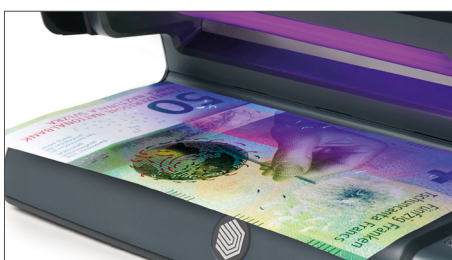
Vérifie les caractéristiques UV des billets de banque