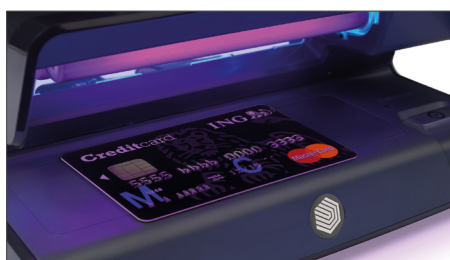
Vérifie les caractéristiques UV des cartes de crédit