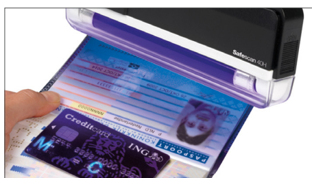
Vérifie les cartes de crédit, les passeports et autres pièces d'identité