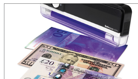
Vérifie toutes les devises