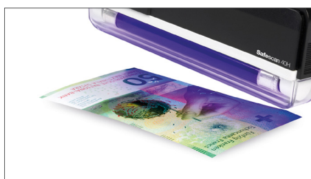
Vérifie les caractéristiques UV des billets de banque