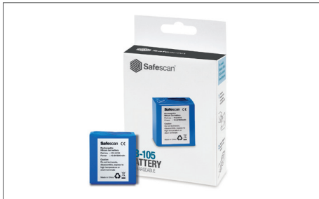
Safescan LB-105 Batterie rechargeable Art. no: 112-0410