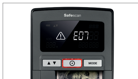
Alerte visuelle et sonore à la détection de billets suspects