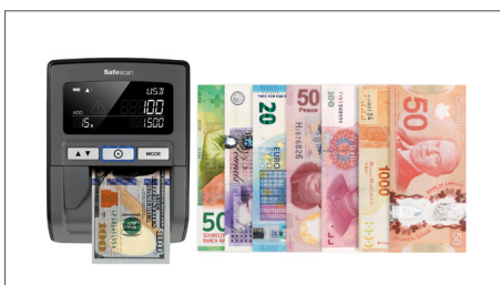
Les billets peuvent être présenté dans n'importe quel sens