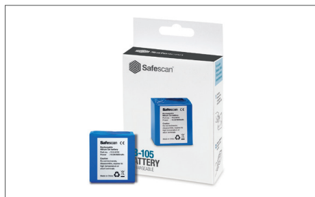
Safescan LB-105 Batterie rechargeable Art. no: 112-0410