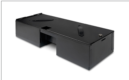
Safescan 4617CL Tapa con llave Art. no: 121-0571