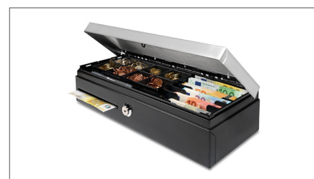
Con la tapa metálica estampada