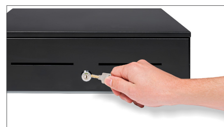
Con cerradura de 3 posiciones (cerrado, en espera y abierto)