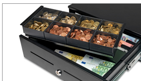
Gaveta extraíble para 8 tipos de monedas diferentes