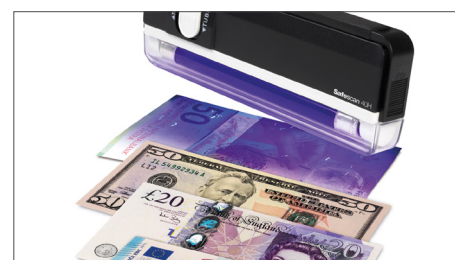
Verifica todas las divisas