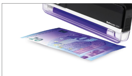
Verifica las características UV de los billetes