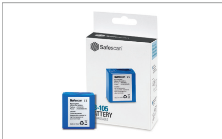
Safescan LB-105 batería de litio recargable Art. no: 112-0410