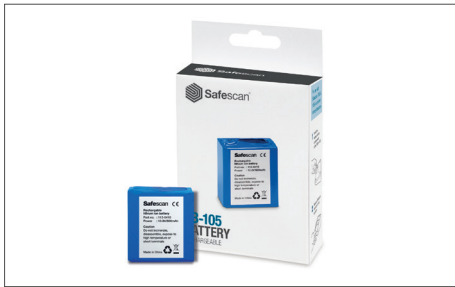
Safescan LB-105 La batería de litio recargable Art. no: 112-0410