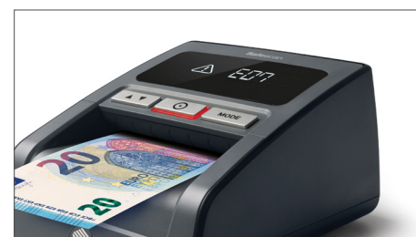
Alarma de billete sospechoso con alerta visual y auditiva