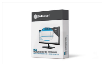
Software MCS Safescan Art. n.º: 124-0500