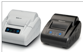
Impressora térmica Safescan TP-230 Art. n.º: 134-0475 cinzento Art. n.º: 134-0535 preto