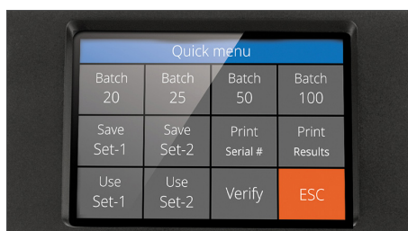
Ecrã tátil de alta definição com interface multilingue e menu rápido