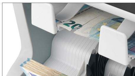
Identifica notas não adequadas para caixas eletrônicas e recirculação