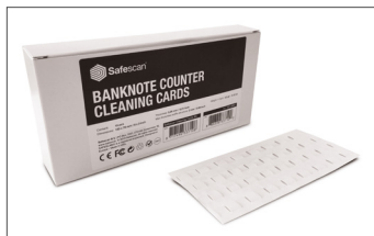
Cartões de limpeza Safescan Art. n.º: 152-0663