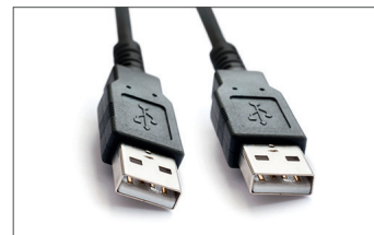
Cabo USB Safescan Art. n.º: 124-0458