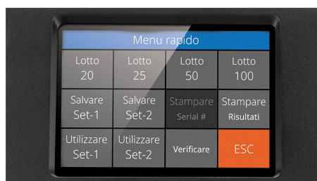
Touchscreen ad alta definizione con interfaccia multilingue e menu rapido