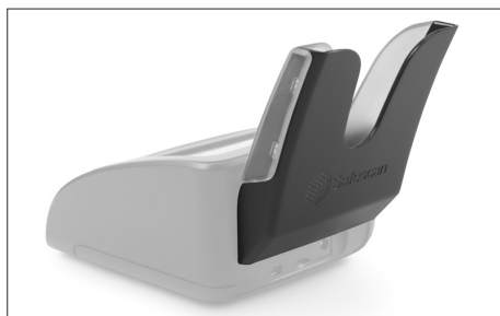
Safescan RS-100 Art. nº: 112-0695