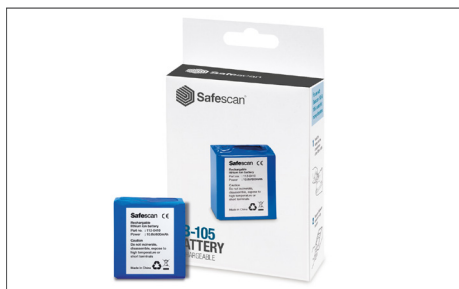
Safescan LB-105 Art. nº: 112-0410