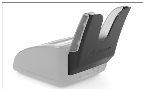
Safescan RS-100 Art. no: 112-0695