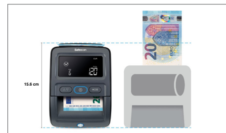
Ha uno degli ingombri operativi più piccoli disponibili rispetto ad altre soluzioni presenti sul mercato