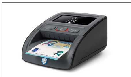
Controlla le banconote utilizzando fino a sette caratteristiche di sicurezza