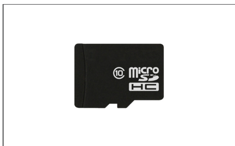
Safescan Scheda Micro SD N. art.: Varie (a seconda del dispositivo e delle valute)