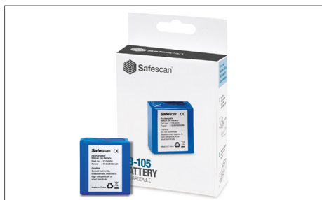
Safescan LB-105 Art. no: 112-0410