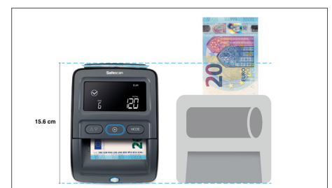
Hat im Vergleich zu anderen Produkten auf dem Markt eine der kleinsten verfügbaren Betriebsflächen