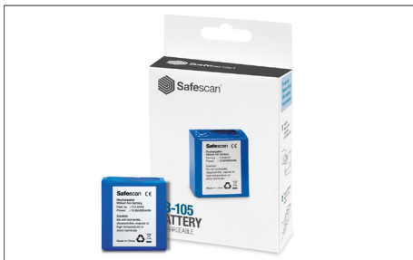
Safescan LB-105 Art. no: 112-0410