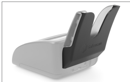
Safescan RS-100 Art. no: 112-0695