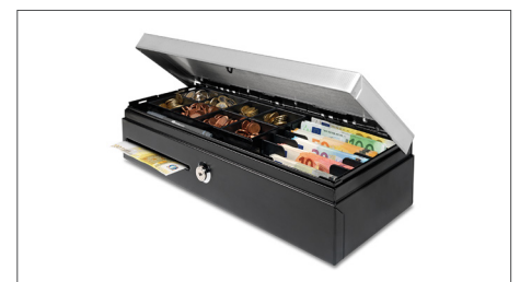
Robustes Designs aus Metall