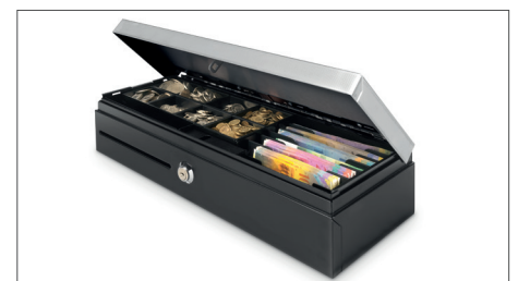
Robustes Designs aus Metall