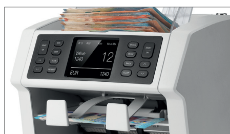
Modus Value-mix: Zählung von Banknoten in Bündelungen eines voreingestellten Werts