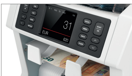
Als Falschgeld identifizierte Banknoten werden im Auswurfach ausgegeben