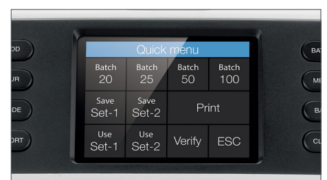
Großer Touchscreen mit Schnellmenü und numerischem Tastenfeld