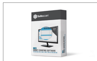
Safescan MCS Geldzählsoftware Software Art.no: 124-0500