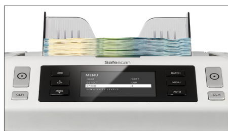
Anpassbare Zählgeschwindigkeit: 800, 1.200 oder 1.500 Scheine pro Minute