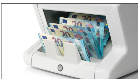
Zählt sortierte Banknoten aller Währungen