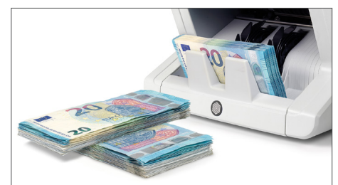
Bündel-Funktion zur an Banknoten