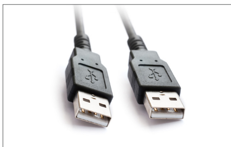
Safescan USB Kabel Art. no: 124-0458