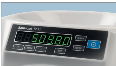
ZÄHLT UND SORTIERT MÜNZEN NACH WERTIGKEIT