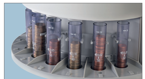
EUROMÜNZRÖHREN ZUM EINFACHEN BEWAHREN IN MÜNZROLLEN