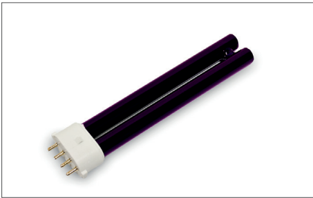
Safescan 50 / 70 UV-Lampe Art. no: 131-0411