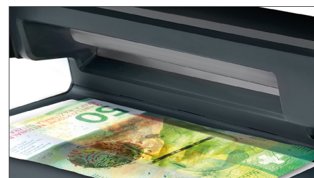
Großer LED Gegenlichtbereich zur Prüfung von Wasserzeichen, des Metallfaden und von Mikrotext