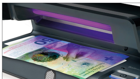
Prüft die UV-Merkmale von Banknoten