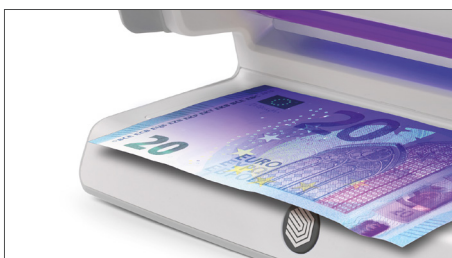
Prüft die UV-Merkmale von Banknoten