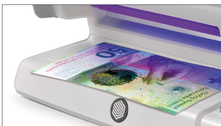
Prüft die UV-Merkmale von Banknoten