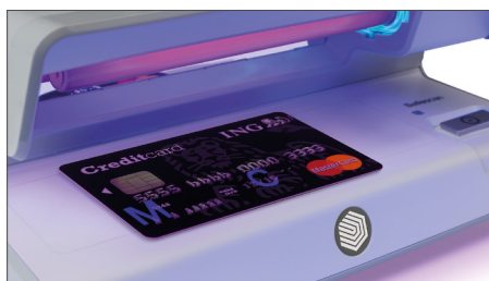
Prüft die UV-Merkmale von Kreditkarten