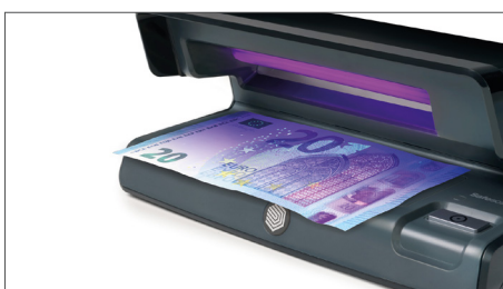
Prüft die UV-Merkmale von Banknoten