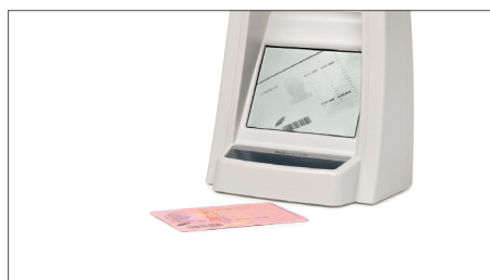
Prüft die Echtheit von Führerscheinen und Ausweisdokumenten