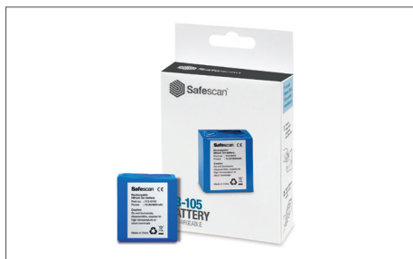
Safescan LB-105 Aufladbare Batterie Art. no: 112-0410