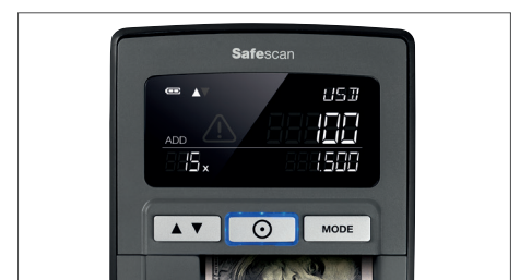
Zeigt die Menge und die Summe der geprüften Banknoten an