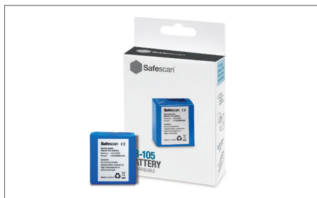
Safescan LB-105 Aufladbare Batterie Art. no: 112-0410