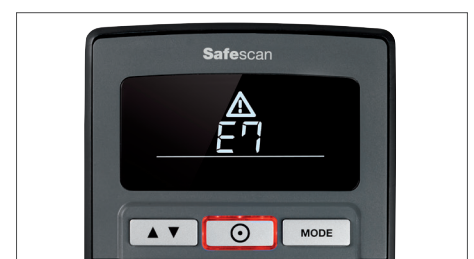
Akustisches und visuelles Alarmsignal