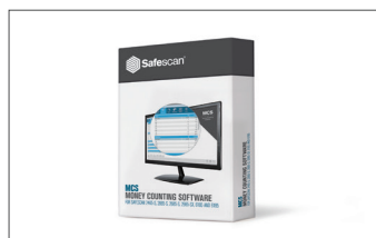
Software Safescan MCS Č. v.ýr.: 124-0500