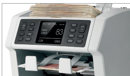
Smíšené hodnoty: počítá ceny ve stozích přednastavené hodnoty