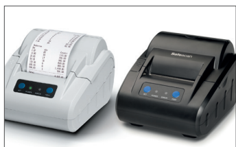
Termální tiskárna Safescan TP-230 Č. v.ýr.: 134-0475 šedá Č. v.ýr.: 134-0535 černá