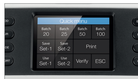
Barevná dotyková obrazovka s rychlou nabídkou a numerickou klávesnicí