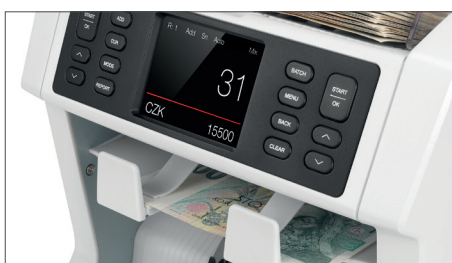
Bankovky, u nichž je podezření, že jde o padělek, se umístí do zásobníku na podezřelé bankovky