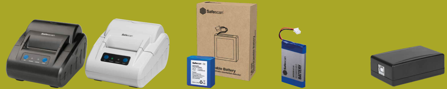
Safescan TP-230 Thermo-Belegdrucker Safescan TP-230 Thermo-Belegdrucker Safescan LB-105 Wiederaufladbarer Akku Safescan LB-205 Wiederaufladbarer Akku Safescan UC-100 USB-Kassenladenöffner

Für das gesamte Safescan-Zubehör besuchen Sie www.safescan.com