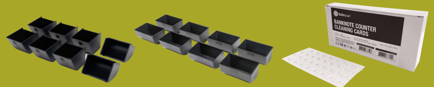
Safescan 4617CC Münzbecher-Set Für Kassaladen & Geldwaagen Safescan 4141CC Münzbecher-Set Für Kassaladen & Geldwaagen Safescan Cleaning Cards Für Geldzählmaschinen