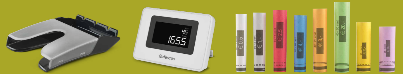
Safescan RS-100 Abnehmbarer Stapler Safescan ED-160 Externes LCD-Display Safescan CR-120 Papier Münzhüllen